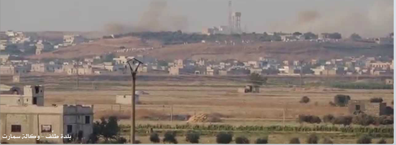
بلدة طلف

تقع بلدة طلف غرب ناحية حريف حماة الجنوبي. وتعد من القرى المحاصرة بسبب قطع جميع الطرق المؤدية إليها. ويبلغ عدد سكانها حالياً حوالي 12000 نسمة من أهلها ومن النازحين من مناطق أخرى.