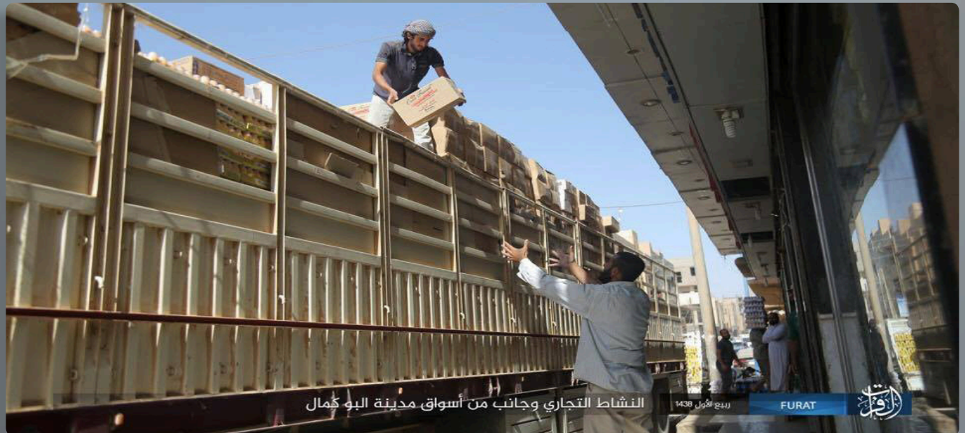
النشاط التجاري وجانب من أسواق مدينة البوكمال

صرف استثمار النفط والدعم الخارجي الأنظار عن اقتصاد المنطقة الأساسي، على أن تعطل طريق الشامية بسبب الحرب، واعتماد طريق شمال النهر، ساعد في نمو حركة التجارة والخدمات في قرى وبلدات ونواحي الجزيرة بنسب متفاوتة، مع احتفاظ المدن بمكانتها. فكانت الثروة الطارئة تشبه إلى حد بعيد السلطة في ذلك الوقت، من جهة توزعها وانتشارها على طيف بشري واسع متوازن النفوذ، وتبادل الموافقة الضمني بين الفاعلين