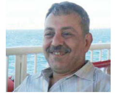
■ بكر صدقي

بعد أقل من أسبوع حدّد يوم الثلاثين من كانون الأول لبدء تطبيق وقف إطلاق النار، بعد حصول موسكو على موافقة كل من النظام والقسم الأهم من الفصائل العسكرية للمعارضة. بالقياس إلى المحاولات السابقة لوقف الحرب وإطلاق حل سياسي، نلاحظ زخماً كبيراً لا سابقة له، يعبر عن