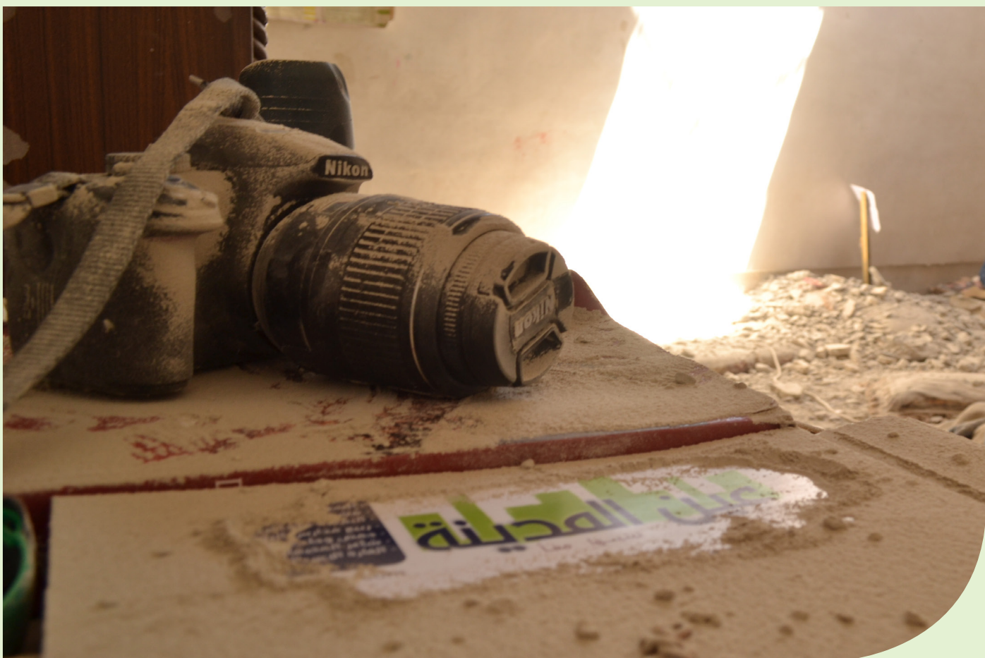
مكتب عين المدينة بدير الزور بعد القصف