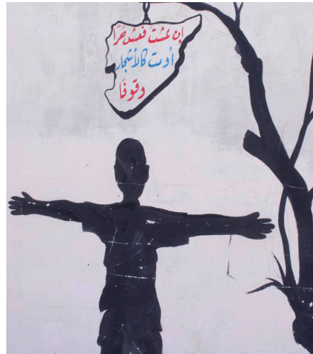
إحدى اللوحات الجدارية في الباب

علينا عملية التحرير التي شاركت فيها معظم كتائب الريف. وسقط الكثير من الشهداء خلال معركة تحرير المءىنة، التي استمرت لعشرة أيام، وانتهت بالتحرير الكامل، يوم 29/7/2013.