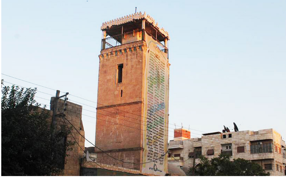
مئذنة الجامع الكبير في الباب | عدسة أحمد

تقع مءىنة الباب في الشمال الشرقي لمءىنة حلب، على مسافة 38 كم منها. ويقدر عدد سكانها بحوالي 200 ألف نسمة.