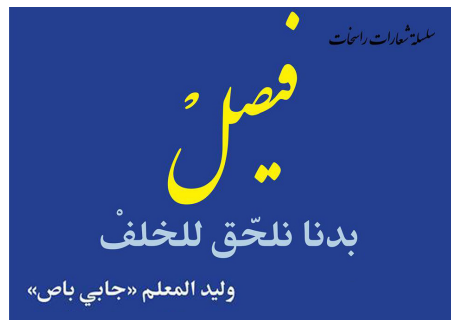
من صفحة شعارات راسخات

لم تكن مصادفة من وليد المعلم في مؤتمره الصحفي أن ينتقي عدة صحفيين ليسألوه أسئلة مجهزة مسبقاً، فيتضح أن مجموعة منهم تعمل لصالح قناة واحدة، فإذا بحوالي خمسة صحفيين من الإخبارية السورية، وضعفهم من التلفزيون السوري، بالإضافة إلى آخرين من سانا، وغيرهم من قناة سما "الدنيا". بذلك يتم ملء الفراغات في القاعة، التي تظهر الحاجة ماسة اليوم لملء مدرجاتها، في ظل غياب مختلف المؤسسات الإعلامية عن الساحة السورية عامة وعن صالمة وليدة المعلم خاصة. هذا الحضور الإعلامي الكثيف في مؤتمر المعلم الصحفي، يوازيه أيضاً حضوراً في فعاليات أخرى، فنية وثقافية واقتصادية وسواها. فتستطيع المؤسسة