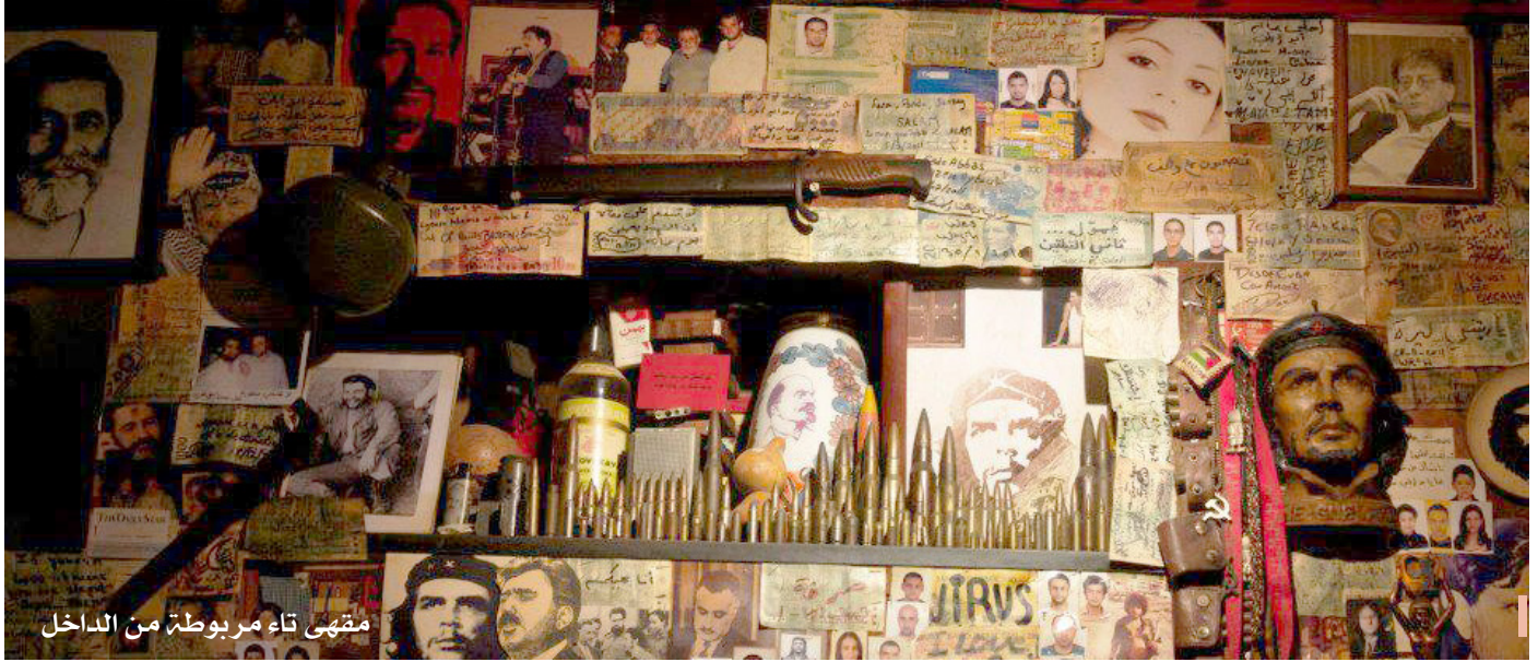
مقهى تاء مربوطة من الداخل

فطيرة من الجبن من مطعم بربر ويمنحها لسيدة سورية بان على وجهها الإعياء، فإذا به يصل إلى المقر الثاني، حانة ميزان. وهناك يلتقي بأصحاب النفس اليساري المتأزم من مراهقين فلسطينيين ولبنانيين، وسوريين يدعون التخرج من معتقلات النظام القمعية. فيشربون نخبهم على أنغام الشيخ إمام وسميح شقير والرحابنة. ويحتد النقاش بينهم إزاء مسؤوليتهم عما يجري في سوريا. فترى أحدهم يضع اللائمة على الثورة التي غيرت مسارها السلمي ورضيت بالجهاد مخرجاً، وآخر يجلد نفسه قائلاً: «لولم تغادر سوريا لما وجدت جهاديين من جنسيات مختلفة يقاتلون بجانب الجيش السوري الحر». إلى أن يتدخل عازف عود رديء ليعيدهم إلى واقعهم، إذ لا قدرة لهم على سماع صوت انفجار فكيف بخوض حرب. حينئذ ينضم الجميع إلى جوقة الفرغ، بمن فيهم الوافدين الجدد إلى الحانة، الذين يشك بأمرهم جميع من حولهم على أنهم عناصر مخابرات جاءوا يستقصون عنهم. تتعقد أزماتهم، لكن الحنين إلى الوطن الجريح يظل الحل الوحيد لجبل لم يكن يحلم إلا بدولة تضمن له حريته وكرامته. وفي ظل انغلاق علاقاتهم الاجتماعية لأسباب أمنية، يبقى شارع الحمرا يلهم شملهم ويكوّن بادرة أمل يومية يعيشونها بألفة تذكرهم بأسواق دمشق وليالي حلب وبطولات حمص وتضحيات دير الزور.