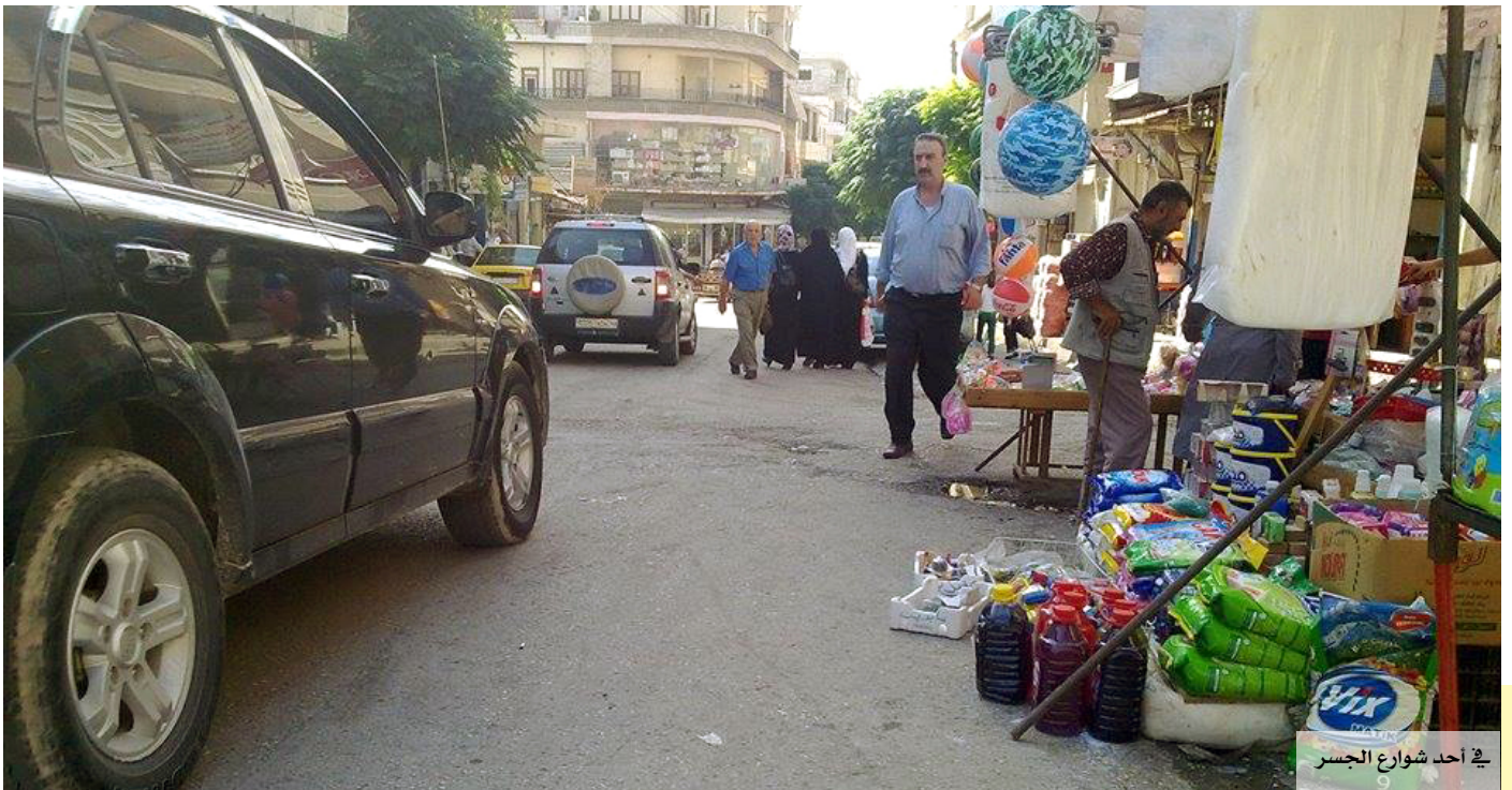
في أحد شوارع الجسر

لم يكن غريباً على أهل هذه المدينة، التي يرتبط اسمها بشكل وثيق بأحداث الثمانينات من القرن الماضي، والتي راح ضحيتها الآلاف المؤلّفة من أهلها، أن تكون من أوّل المشاركين في الثورة. فقد خرجت أوّل مظاهرة فيها يوم الاثنين الأول من نيسان/ أبريل 2011، شارك فيها المئات. وأخذت المظاهرات بالتمدّد والتوسّع بشكلٍ سلبيّ حتى ضاق النظام بها ذرعاً، وسُجّلت أوّل مجزرة في جمعة (أطفال الحرية)، في الثالث من حزيران/ يونيو، سقط فيها ثلاثة شهداء. وخلال تشييعهم قام جنود الأسد بتكرار إطلاق النار فارتفعت الحصيلة إلى 12 شهيداً، لتنتفض المدينة بأكملها، وتقتحمها -بعد أيام- القوات الخاصة في جيش الأسد. وقام النظام بفرص حصار خانق على المدينة وأحكم السيطرة عليها، مما دفع بالأهالي إلى الخروج منها بحثاً عن رقعة فيها شيء من الحرية. الأمر الذي زاد من نغمة النظام عليها وأصابه بهستيريا أدت به إلى اعتقال أي شخص تثبت هويته أنه من جسر الشغور. ورغم ذلك ما زالت المدينة تشهد