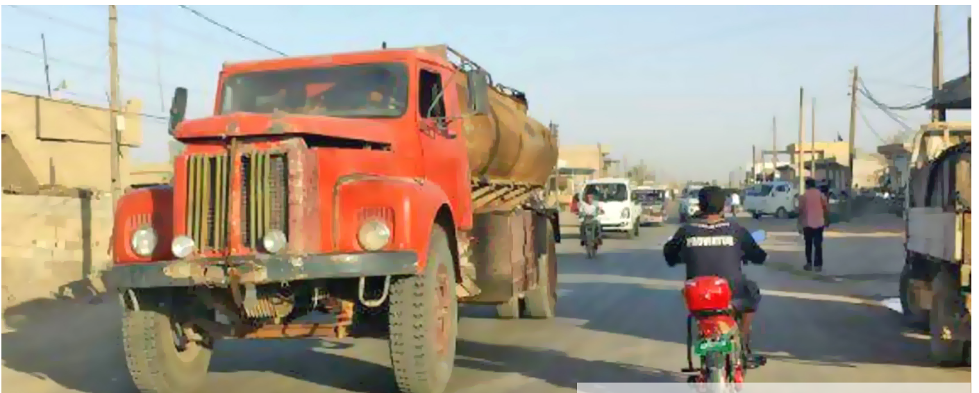
سيارات معدة لنقل النفط في دير الزور