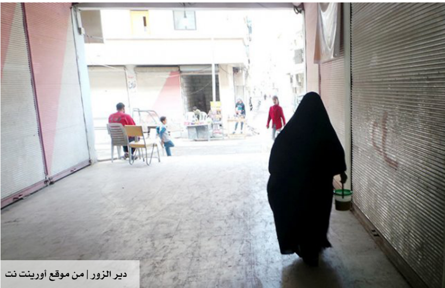
دير الزور | من موقع أورينت نت

كبير في دير الزور ابتداءً من شهر حزيران الفائت، وهو الشهر الذي أكملت فيه "الدولة الإسلامية" سيطرتها على المحافظة. وخضع المشتغلون في أعمال الإغاثية والخدمات لتحقيقات حول عملهم السابق، وألقي ببعضهم في سجون التنظيم بتهمة مختلفة. ولم تتضح حقيقة موقف تنظيم "الدولة" من هذه النشاطات إلا مؤخراً، إذ لم يعد الأمر مجرد حرص على النزاهة -كما زعم سابقاً المقربون من التنظيم- بل تأكدت رغبته في الاستحواذ والسيطرة على كل مفصل من مفصل الشأن العام، إلا في النواحي التي يدرك تماماً أنه عاجز عن القيام بها. ورافق سلوك "الدولة" هذا إيقاف شبه كامل