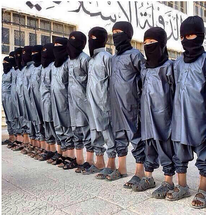
من أحد معسكرات الأطفال في تنظيم الدولة

في دير الزور، وفي المحافظات الأخرى الخاضعة لسيطرته، يعمل تنظيم "الدولة الإسلامية" على تجنيد الأطفال والمراهقين، ويولي اهتماماً بالغاً بهذه العملية، مسخراً لها جزءاً كبيراً من نشاطه الدعوي. فهي أحد الأساليب الرئيسية التي يتبعها لإعادة بناء المجتمع من جديد.