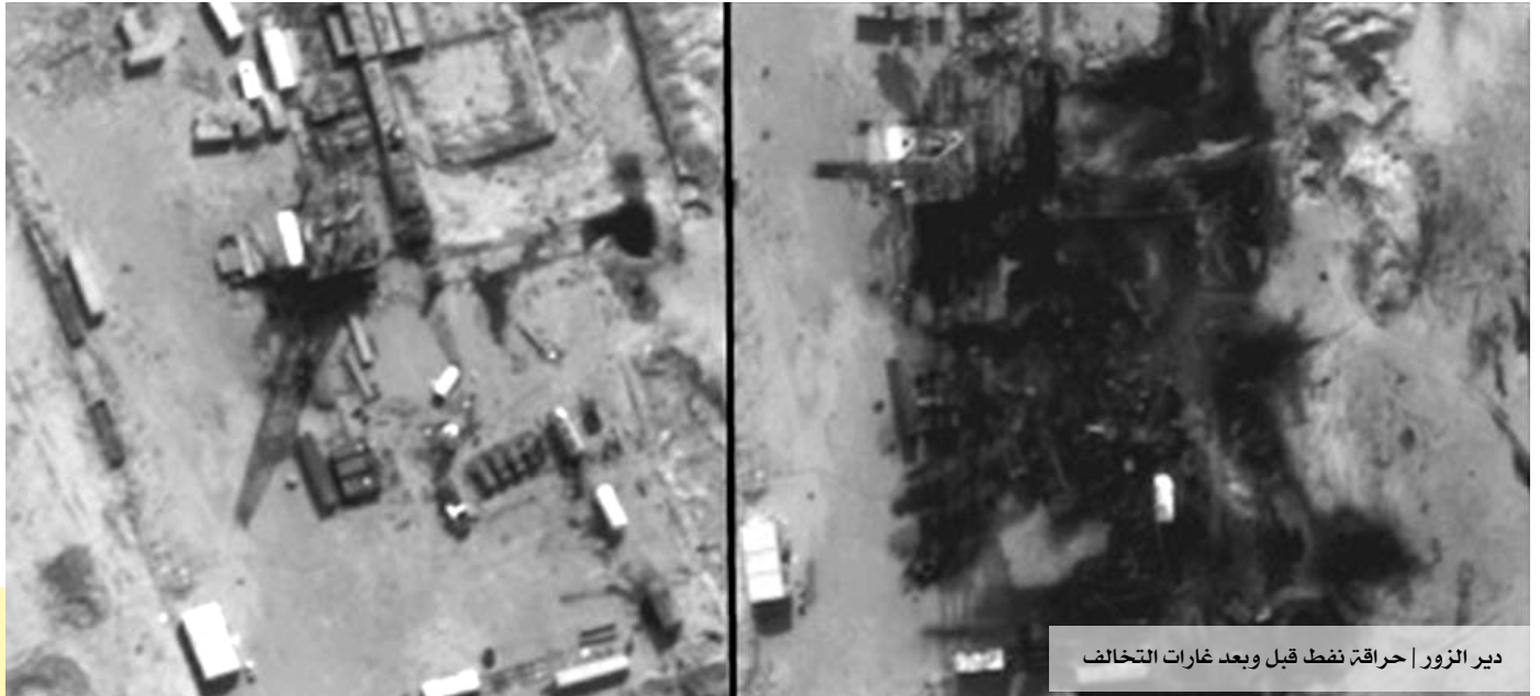
دير الزور | حراقة نفط قبل وبعد غارات التحالف

قتلت طائرات التحالف الدولي، منذ بدء هجماتها على مواقع داعش، 21 مدنياً في محافظة دير الزور. وقتل بشار الأسد خلال المدة نفسها 19 مدنياً.