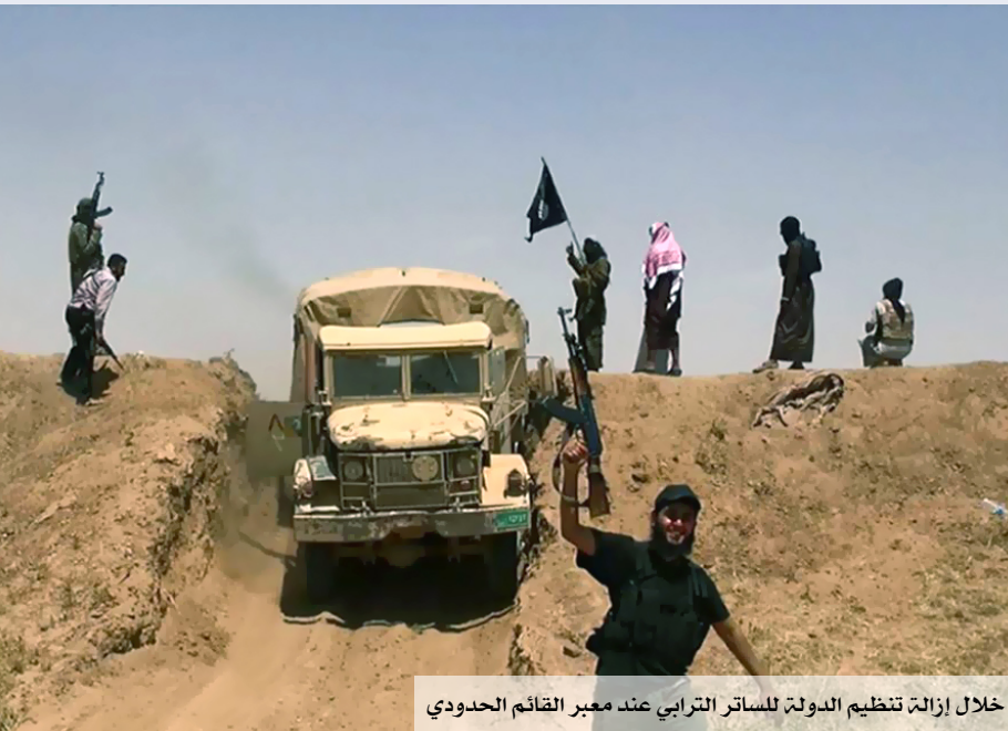
خلال إزالة تنظيم الدولة للساكن الترابي عند معبر القائم الحدودي

رغم أن الظروف القاسية والاستثنائية تؤثر في اللغة إلى أبعد حد، لكن يبقى لمزاج الشعب وثقافته التأثير الذي لا يستهان به عليها.