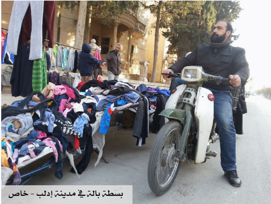
بسطة بالة في مدينة إدلب - خاص

صار شراء الألبسة المستعملة (البالة) الحل الأمثل لكثير من الذين يعيشون في سورية، وأصبحت محال بيع هذه الألبسة مصدر رزقٍ للعديد من الأسر.