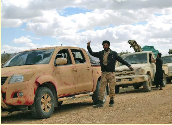
مقاتل من «أسود الشرقية» قبل المعركة - القلمون الشرقي

القادة والشخصيات العسكرية من أبناء دير الزور. وتصورنا له أن يكون جسماً منظماً ومنضبطاً ينصهر الجميع فيه من خلال معسكرات تذيب الفوارق والانتماءات السابقة، وتتجاوز العشائرية والمناطقية. لن نقبل أي انضمام جماعي لكتلة كاملة تبقى كما هي، إنما يخضع الجميع لمعسكرات تعيد دمجهم في كتلة واحدة. ولدينا القدرة على ضم خمسة آلاف مقاتل في هذا الجيش.