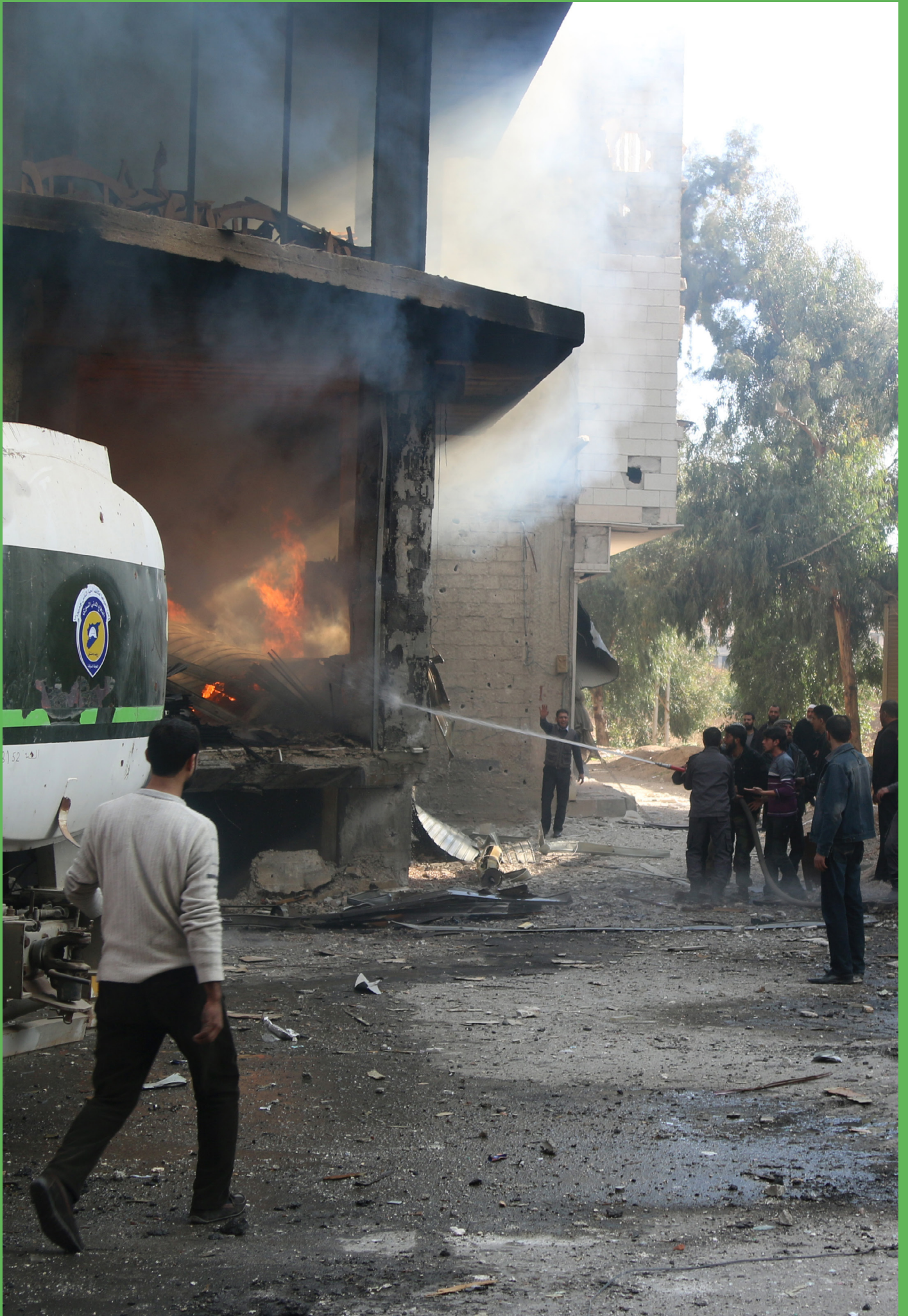
إخماد الحرائق الناتجة عن قصف الطيران الروسي / كفر بطنا