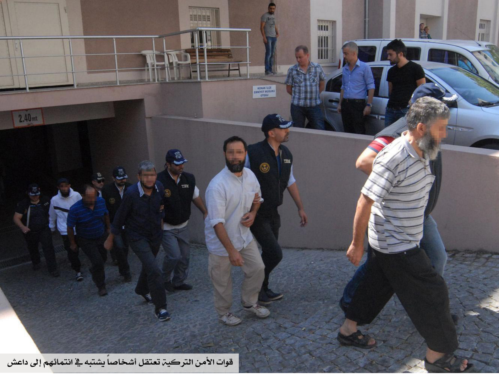
قوات الأمن التركية تعتقل أشخاصاً يشتبه في انتمائهم إلى داعش