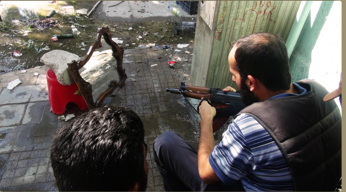
يرقب تحركات الجيش النظامي عبر المرأة