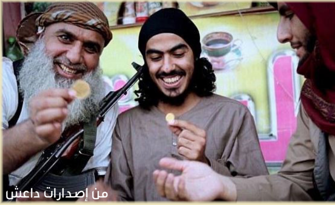
من إصدارات داعش

بحسب أحد كبار التجار في مدينة الميادين، وزاد في وطأة الخوف من العملة على الزبائن والتجار، على حد سواء، شراء البضائع من خارج المنطقة بالدولار الأمريكي وبيعها ب (عملة محلية)، وخوفهم كذلك من كسادها في أيديهم برحيل التنظيم.