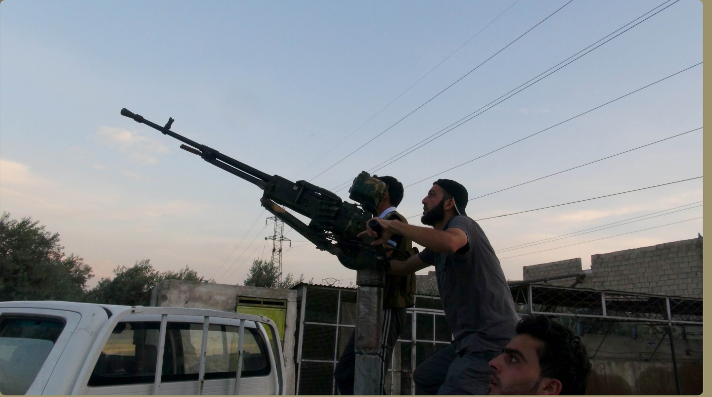
الشهيد عبد القادر الصالح قائد لواء التوحيد