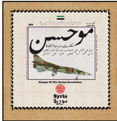
طابع الثورة السورية عن موحسن

يفتخر أبناء موحسن أنهم وأبناء عمومته من عشيرة البوخابور في قريتي البوعمر والمريعية، قاموا بأكبر عملية ثورية ضد الفرنسيين في القرن الماضي، حين هاجموا المطار وأحرقوا الطائرات الحربية الفرنسية وهي على أرضه. ومنذ ذلك اليوم ارتفع الطموح الثوري في المخيلة الشعبية لأبناء