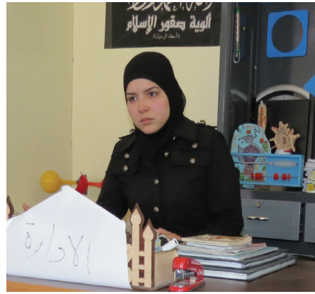
مديرة المدرسة | خاص عين المدينة

نحن نركز على مادة اللغة الإنكليزية لأنها لغة العصر، واللغة العربية التي يعاني الطلاب من ضعف كبير فيها، والرياضيات، بالإضافة إلى مقرر في التاريخ الإسلامي. أما لجهة تقبل الأهالي لفكرة إرسال أبنائهم إلى مدرسة على خط الجبهة تقريباً، فقد قالت المديرية إن البعض يتخوفون بالطبع